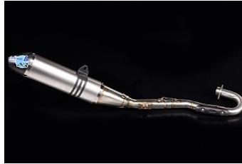
SYSTÈME D'ÉCHAPPEMENT COMPLET LEOVINCE € 716,00