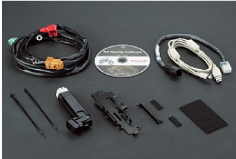
Ensemble « usine » de calibrage d'injection KX FI (en option)