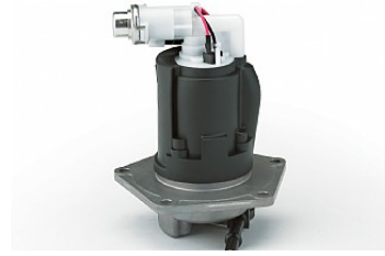
Pompe à carburant allégé