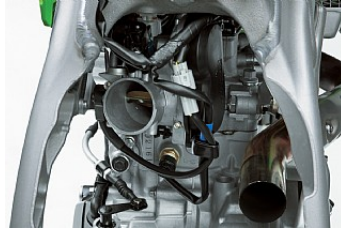
Système à injection sans batterie