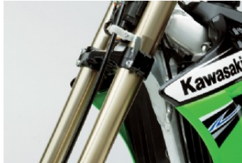
Suspensions de compétition