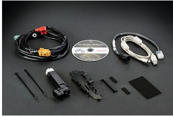
KIT DE CALIBRAGE D'INJECTION ELECTRONIQUE POUR KX € 544,00

Leur installation est explicitement mentionnée comme une exclusion des termes et des conditions de garanties des produits Kaw