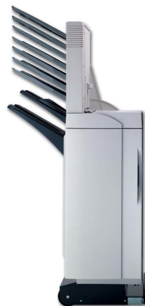
DF-71 + M-2107

Magasin papier haute capacité Capacité 3 000 feuilles (2 bacs de 1 500 feuilles), format A4, 60 à 105 g/m 2