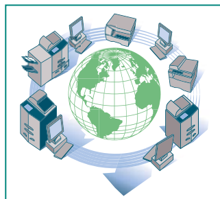
La contrôleur d'impression apporte une réelle intégration dans divers environnements informatiques

permet l'administration et la configuration du parc depuis le poste de travail de l'administrateur réseau.