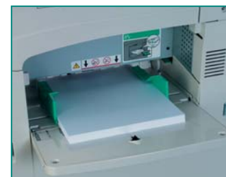
Avec une capacité de 200 feuilles, le by-pass interne peut se refermer et être utilisé comme une source papier supplémentaire