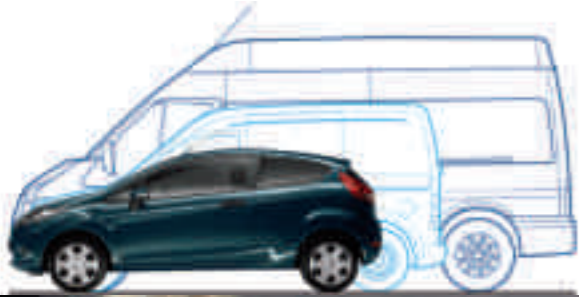
Modèle: Fiesta Van Pack Trend