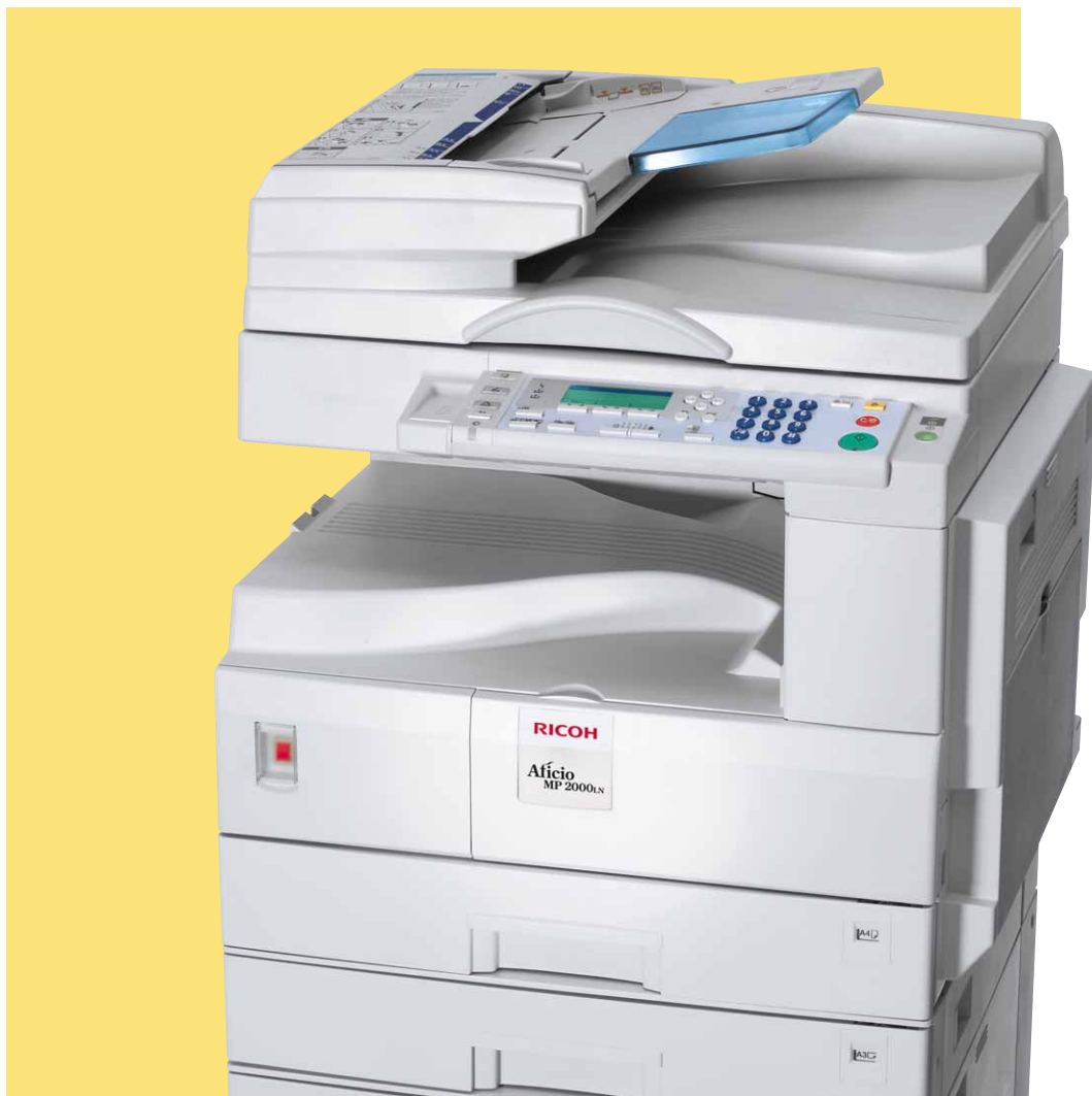
Aficio™ MP 1600L/MP 2000LN

Des partenaires bureautiques A3 flexibles et compacts