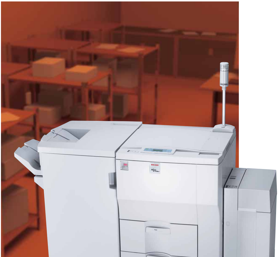
Aficio™ SP 9100DN

Une impression noir et blanc ultra-performante et à moindre coût