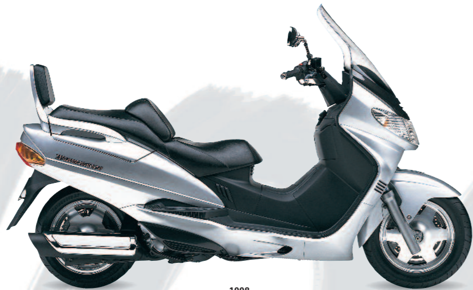
1998 Burgman 250/400