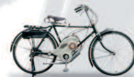
1952 Power Free