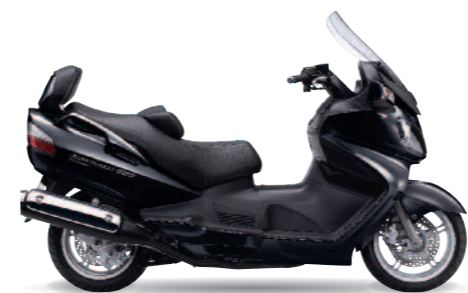
Burgman 650 Executive

conserve une excellente maniabilité en ville, tandis que sa partie-cycle lui confère des aptitudes routières de premier ordre. Aussi facile en usage soutenu qu'en ballade, son châssis fait appel à un cadre acier tubulaire, pourvu d'une fourche télescopique hydraulique et d'un double combiné amortisseur arrière réglable en précontrainte. Dans sa version Executive, le Burgman 650 reçoit un dossier de selle passager, un freinage ABS intégral, un pare-brise motorisé et des rétroviseurs rétractables électriquement. Il adopte également des poignées chauffantes (❶) et une selle chauffante pour le pilote et le passager (❷).