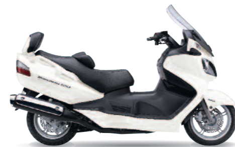
Burgman 650 Executive