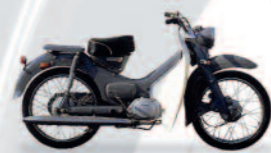
1963 M30 Cellpet