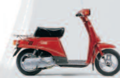
1982 CL50 Love