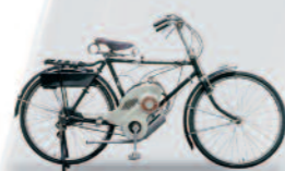
1952 Power Free