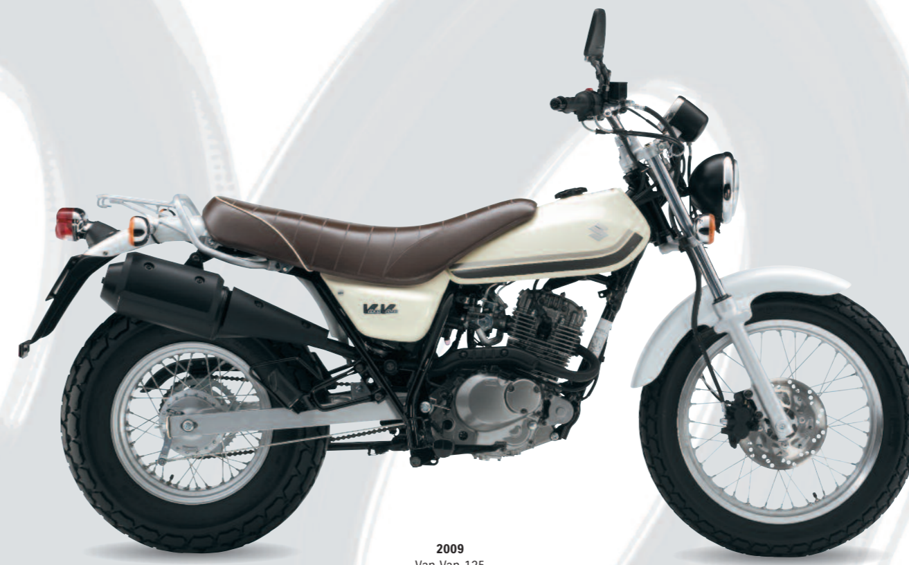
2009 Van Van 125