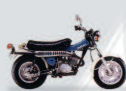
1973 Van Van 125