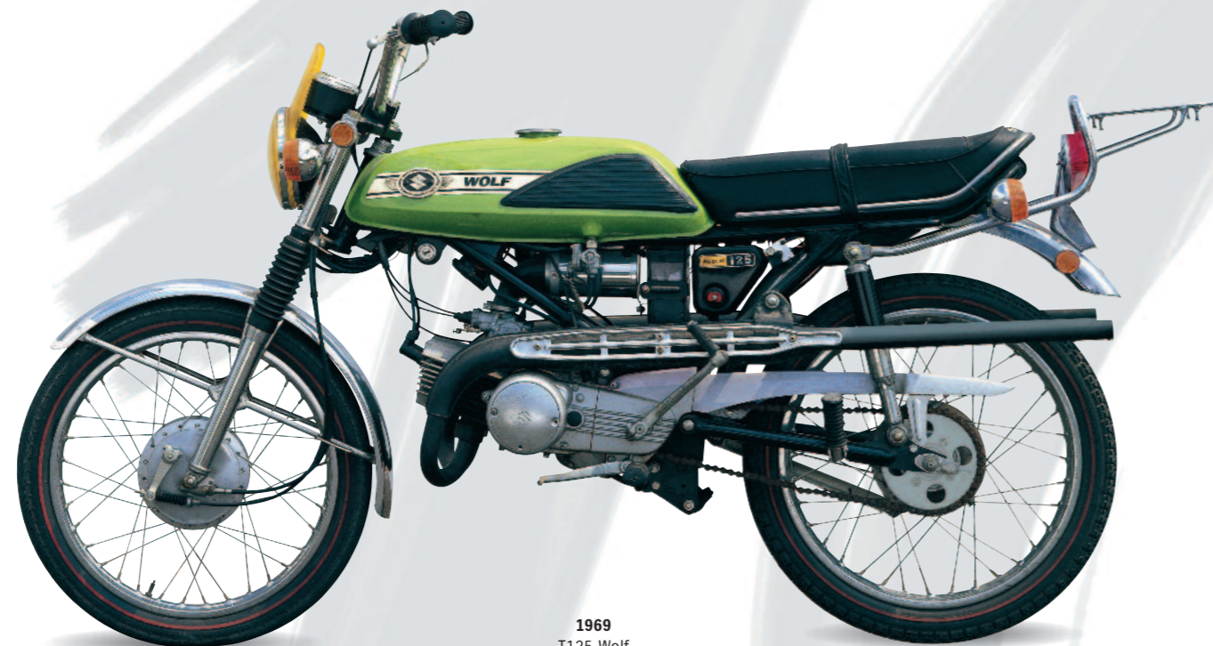
1969 T125 Wolf

Durant les années 60, Suzuki multiplie les deux-temps de petites cylindrées à usage routier. Comme la T125 Wolf 5 vitesses de 1969 au long échappement type scrambler, de nombreux modèles s'inspirent alors de l'univers du tout-terrain. Il en va de même pour la TS125 de 1971 qui revendique fièrement sa filiation avec la machine cinq fois Championne du Monde de moto-cross pilotée par Roger de Coster. Capable de 120 km/h en pointe, la routière GT125 bicylindre marque le succès d'une gamme urbaine Suzuki, performante et diversifiée.