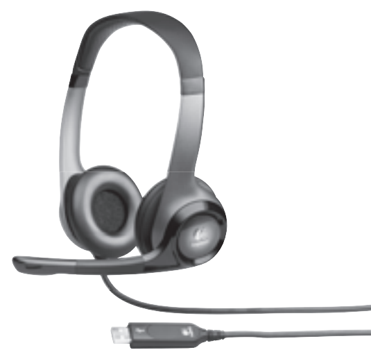
Logitech® ClearChat Pro USB™ www.logitech.com