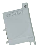
PHARAO-II 4ED (AC)