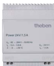
Alimentation secteur 24 V DC