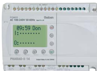
PHARAO-II 14 (CA)