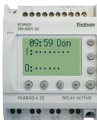
PHARAO-II 10 (CA) PHARAO-II 11 (CC)