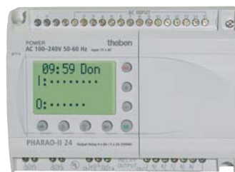
PHARAO-II 24 (CA)