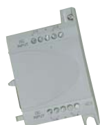
PHARAO-II 4EDA (DC)