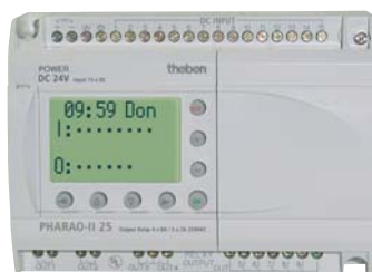
PHARAO-II 25 (DC)