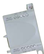
PHARAO-II 4AR (AC)