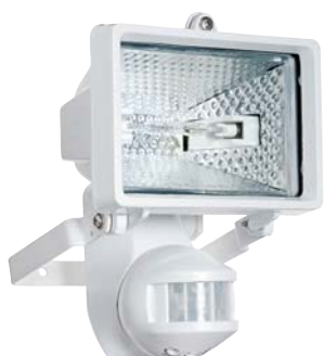
LUNA 102/150 L

Réglage pour : LUNA 102/150L et 102/500L