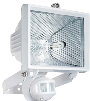
LUNA 102/500 L