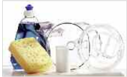
Nettoyez immédiatement après utilisation (eau + produit vaisselle) Essuyez les pièces soigneusement