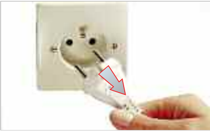
Débranchez toujours avant nettoyage