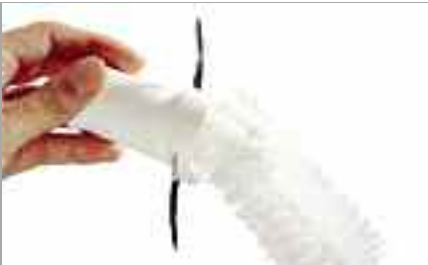
Accessoires : utilisez un goupillon pour nettoyer la base des accessoires