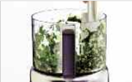
Si nécessaire rabattez les aliments avec la spatule et donnez 2/3 pulsions