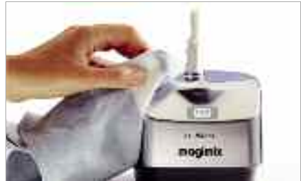
Bloc moteur : essuyez-le avec un chiffon doux humide

Afin de préserver l'aspect et la longévité des éléments amovibles, veillez à respecter les conditions suivantes: