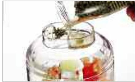
Ajout de solide par la fente du couvercle