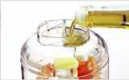
Ajout de liquide par le compartiment liquides du couvercle