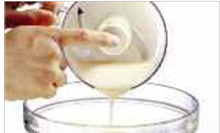
Tenez le couteau en versant le contenu