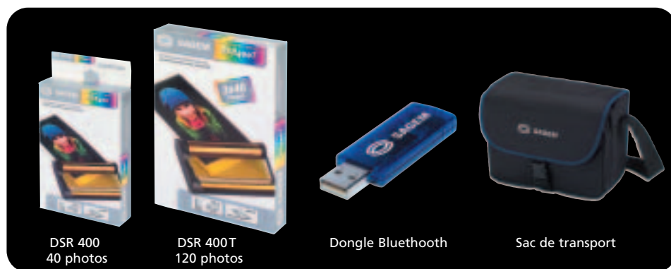
DSR 400 40 photos