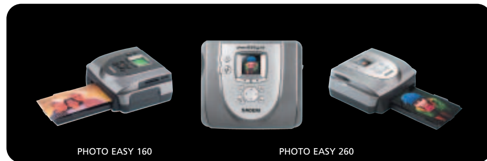
PHOTO EASY 160

Toujours disponible, il vous suffit de la brancher et d'imprimer, sans même passer par votre ordinateur !