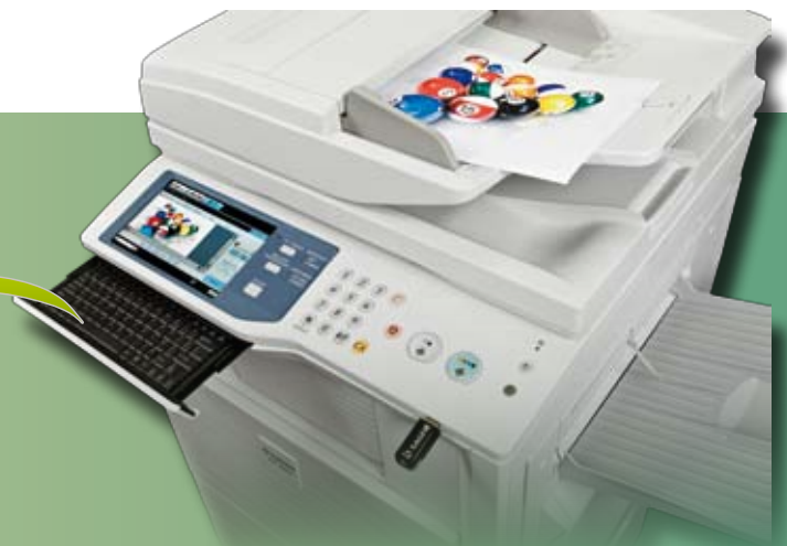
--- écran tactile + clavier retractable