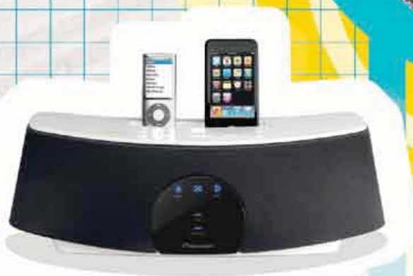
XW-NAC1 Station d'accueil iPod double