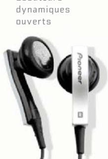
SE-CE10-XK Écouteurs dynamiques ouverts