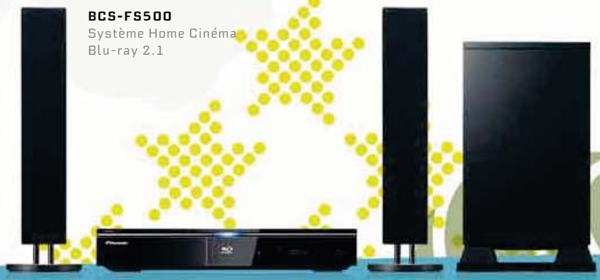
BCS-FS500 Système Home Cinéma Blu-ray 2.1