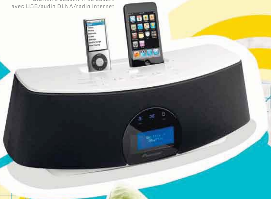
XW-NAC3 Station d'accueil iPod double avec USB/audio DLNA/radio Internet

BRANCHEZ, ÉCOUTEZ, RECHARGEZ ET PROCÉDEZ À LA LECTURE ALÉATOIRE de 2 iPods ou iPhones