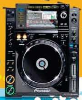
CDJ-2000 Station DJ numérique de niveau professionnel