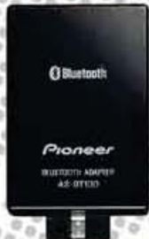
AS-BT100 Adaptateur Bluetooth (en option)

Pour en savoir plus : www.pioneer.fr/ipodock