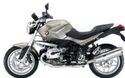
gris cristal métal