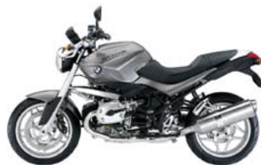
gris granit métal mat