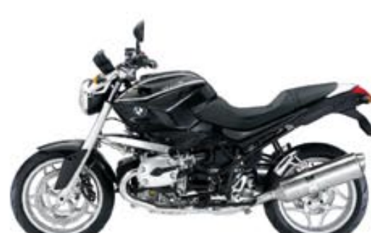
noir uni avec liseret blanc décoratif (en option)