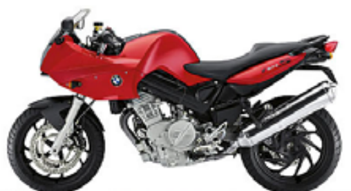
rouge flamme uni