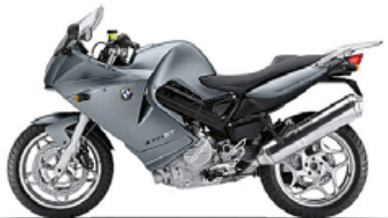
graphitan 2 métal mat