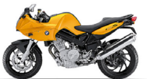
jaune sunset uni