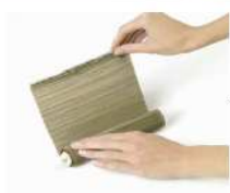
La natte en bambous spéciale california rolls