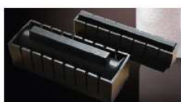
Les moules à makis