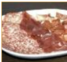
petites charcuteries Vleeswaren