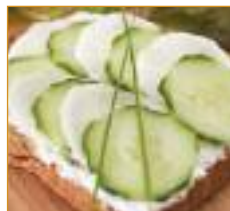
fruits et légumes Groente en fruit