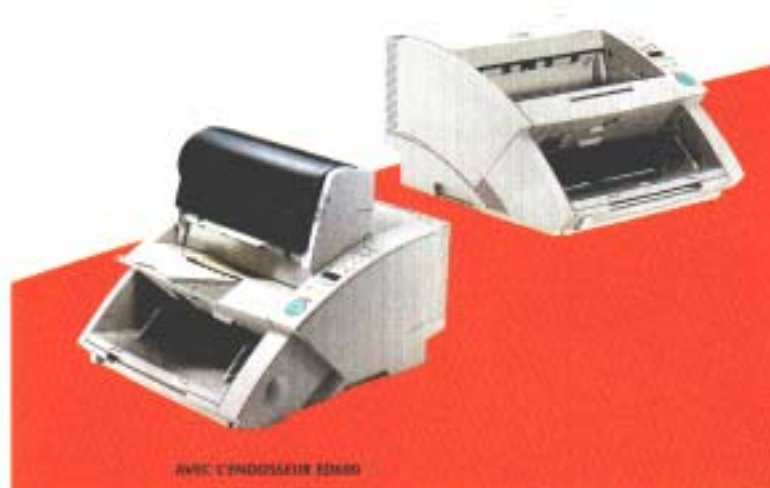
Avec l'endosseur ED600