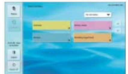
Écran de bouton de tâche

Plutôt que de conserver toutes les cartes de visite que l'on vous distribue, vous pouvez très facilement les numériser. Le ScanFront 220/220P traite plusieurs cartes à la fois et accepte même les cartes en relief.