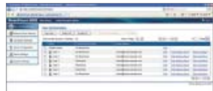
Menu Web Administrateur du ScanFront 220/220P

Bonne nouvelle pour les départements informatiques : la simplicité d'utilisation s'étend au processus de configuration. De nouveaux utilisateurs peuvent être créés à distance à partir du menu Web du ScanFront, l'attribution de leurs droits d'accès et d'utilisation ne prenant que quelques minutes. Le menu Web permet également à l'administrateur informatique de contrôler un parc entier de scanners ScanFront 220/220P via le réseau. La configuration de chaque ScanFront peut être sauvegardée et restaurée à distance.