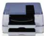
W2200 Sortie A3+

La technologie unique des têtes d'impression Canon produit des couleurs de qualité exceptionnelle à une vitesse record.