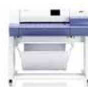
W7200 36 pouces (A0)