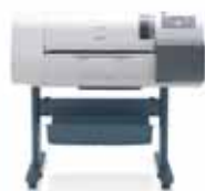
W6400/W6400D 24 pouces (A1)