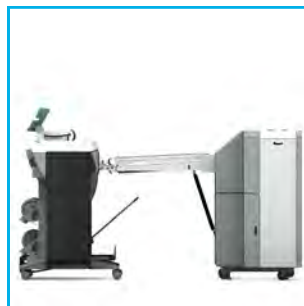
Plireuse deux plis Océ 4311 + Océ ColorWave 300