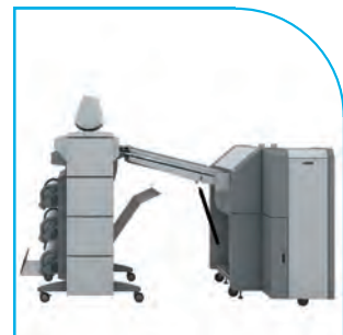
Plireuse deux plis Océ 4311 + Océ TCS500

* Le niveau d'intégration varie selon le type d'imprimante à laquelle est reliée la plieuse. Pour plus d'informations, contactez votre représentant commercial.