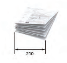
Paquets pliés standard