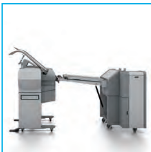
Plireuse deux plis Océ 4311 + Océ ColorWave 550 et Océ ColorWave 650