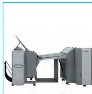
Plireuse deux plis Océ 4311 + Océ PlotWave 350