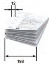
Paquets pliés standard avec bande de renforcement