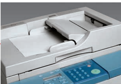
Chargeur automatique des documents très productif

Les bureaux très actifs qui sont souvent confrontés à une plus grande charge de documents apprécieront plus particulièrement le chargeur automatique de documents ADF disponible en option qui représente la façon la plus aisée d'augmenter leur efficacité. Cette fonctionnalité permet à la machine de scanner et de copier automatiquement tous vos documents à pages multiples, vous libérant ainsi pour réaliser des travaux plus importants.