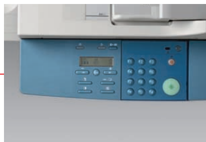
Panneau de commande clair et convivial