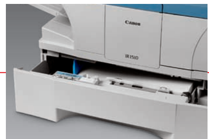
Cassette grande capacité de 500 feuilles