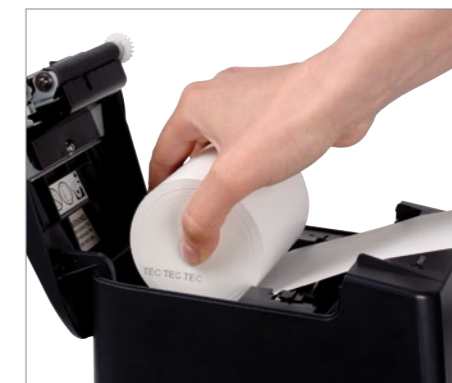
Chargement aisé du papier (drop-in)