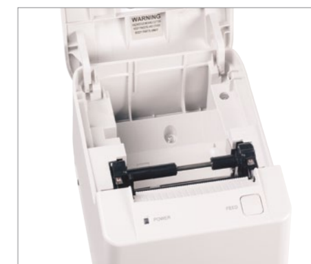
Composants facilement accessibles pour une maintenance simplifiée