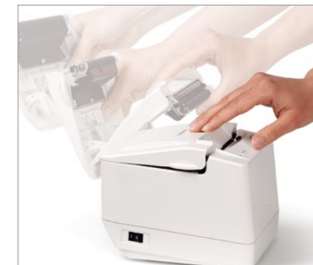
Choix des mécanismes d'ouverture

Économisez du papier et créez des promotions avec l'imprimante thermique double face TRST-A15