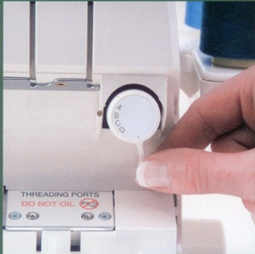
Présélection de la couture