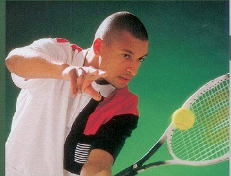
... nous réveillons le pro qui sommeille en vous.