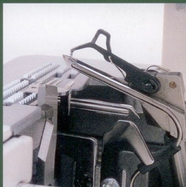
Boucleurs très puissants avec boucleur auxiliaire articulé