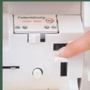
Système d'enfilage de boucleur à jet d'air Tout simplement génial!!!