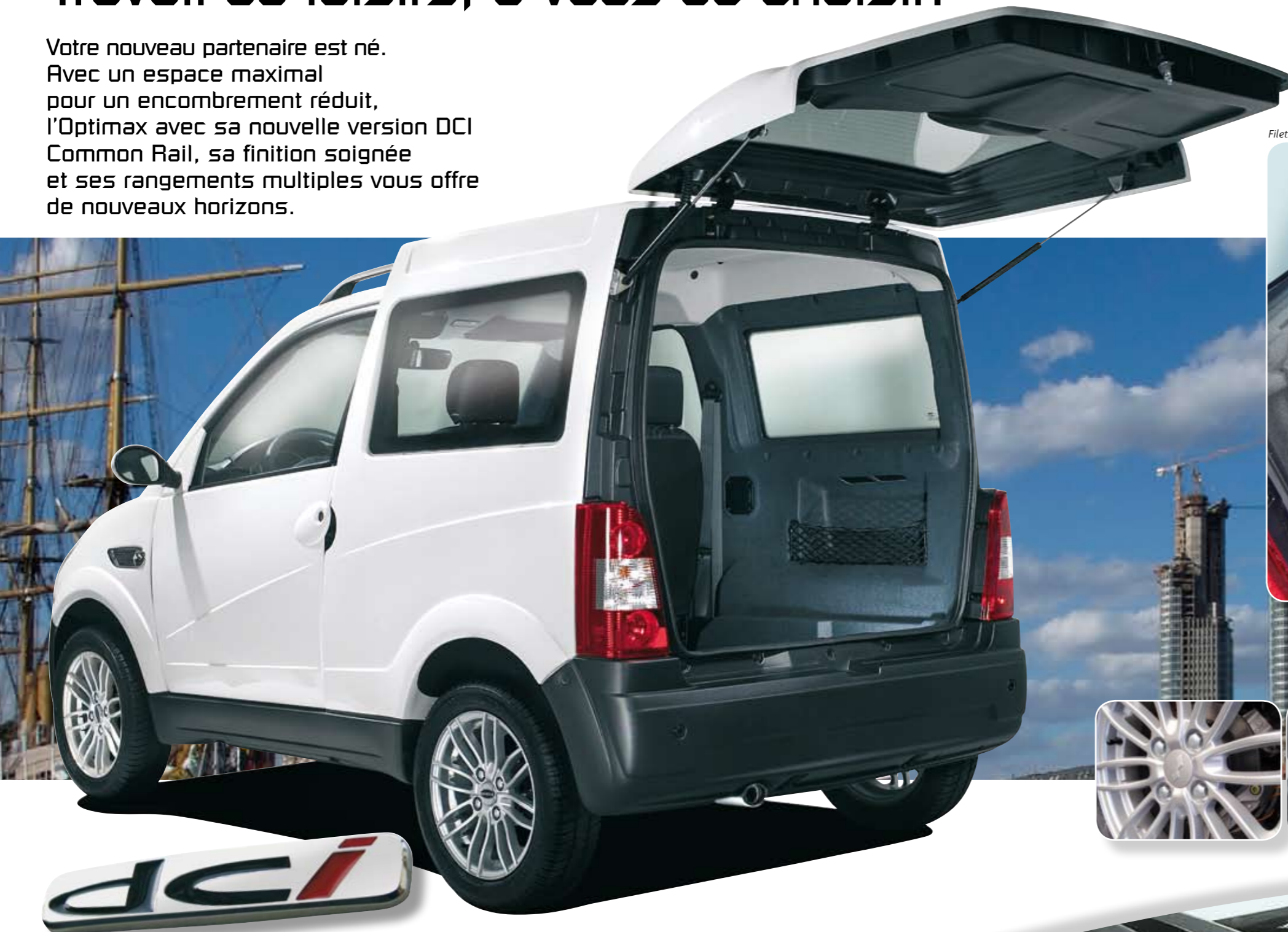
Filets de coffre livrés en accessoire

Votre nouveau partenaire est né. Avec un espace maximal pour un encombrement réduit, l'Optimax avec sa nouvelle version DCI Common Rail, sa finition soignée et ses rangements multiples vous offre de nouveaux horizons.