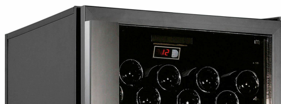
Porte vitrée Aluminium Anodisée Noir