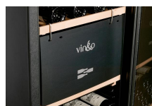
Tableau de cave amovible masquant la zone de Vieillessement