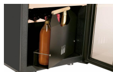
Panier de transport