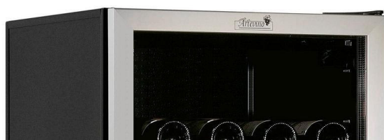
Porte vitrée Aluminium Brossé