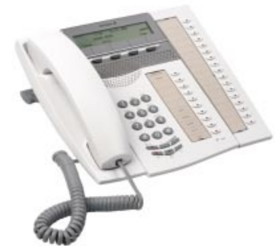
MD Evolution System telephone