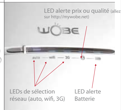
LED alerte prix ou qualité (allez sur http://mywobe.net )