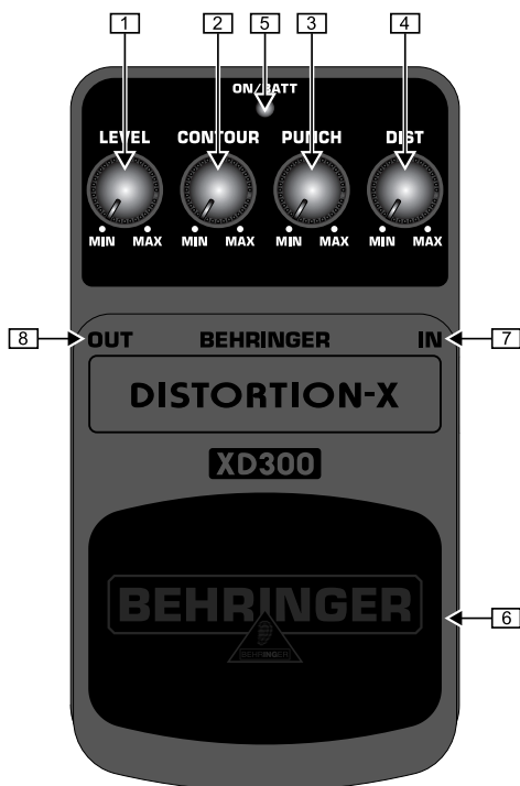
Vue d'en haut