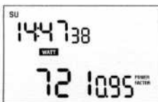
FIGURE 6 Affichage de la puissance consommée