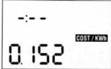
FIGURE 3 Programmation du tarif local