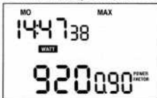
FIGURE 7 Affichage de la puissance maximale