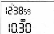
FIGURE 8 Affichage de la consommation d'énergie