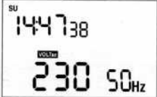
FIGURE 4 Affichage de la tension alternative