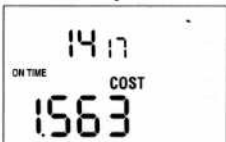
FIGURE 9 Affichage des coûts