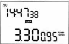
FIGURE 5 Affichage de l'intensité du courant