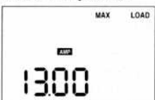
FIGURE 10 Affichage de la charge maximale