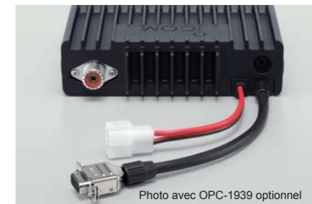
Photo avec OPC-1939 optionnel

Avec le câble optionnel D-SUB 15 pins OPC-1939, il est possible de programmer la série IC-F5023H pour le contrôle du canal sélectionné par un périphérique externe (jusqu'à 16 canaux pré-programmés). Selon la programmation effectuée, le connecteur ACC permet d'activer une fonction de détection de contact d'allumage, de commande PTT externe, commande PC, klaxon, sortie audio et entrée de signal modulé.