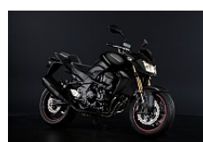
Noir mat Ebony