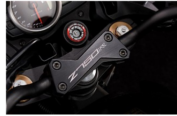
PONTET € 65,00