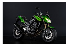
Vert Candy Lime Green / Noir Ebony

Modèle 2011. Prix de vente conseillé TTC, comprenant les frais de transport et la mise en route du véhicule. Tarif au 20/01/2011