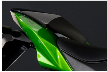
COUVRE-SELLE PASSAGER € 174,00