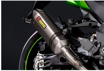
ECHAPPEMENT AKRAPOVIC COURT* € 697,00