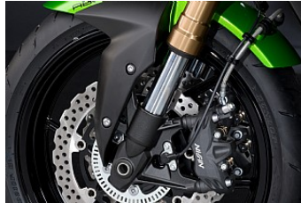
Freins haut de gamme