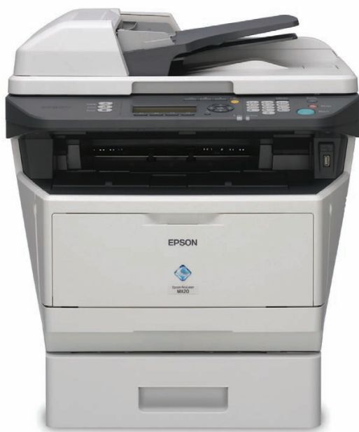
Version AcuLaser MX20DTN

La Série Epson AcuLaser MX20DN répond à tous les besoins de votre entreprise avec ses fonctions d'impression, de numérisation, de copie, de fax (modèle DNF), et grâce au Recto Verso automatique intégré en standard.