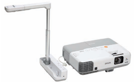
Partagez des objets en 3D avec le visualiseur de document ELP-DC06