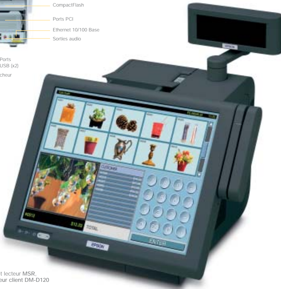
IR-700 avec écran tactile 15 pouces et lecteur MSR, imprimante ticket TM-T88III et afficheur client DM-D120