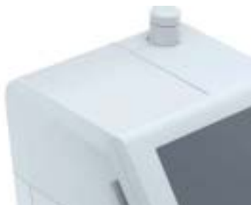
Capot de substitution