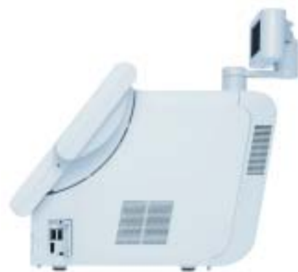
2 ports USB 2.0 supplémentaires se trouvent très bien placés sur le côté droit

L'IR-700 offre une grande flexibilité quant à l'aménagement du comptoir de vente. Sa taille réduite permet une intégration facile dans le