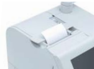
Imprimante TM-T88III intégrée

Avec son nouveau terminal point de vente IR-700, Epson inaugure une nouvelle génération de TPV. Grâce à ses performances exceptionnelles, sa fiabilité, sa simplicité d'utilisation et son élégance, l'IR-700 est le système intégré idéal pour l'équipement des magasins et des chaînes de restauration.