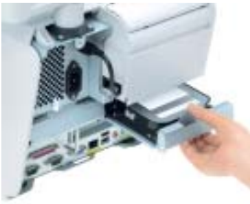
Les deux disques durs très accessibles facilitent l'installation et la maintenance