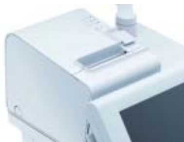
Imprimante sur plateau : TM-L90 (tickets ou étiquettes) ou FP-90 (Solution fiscale pour l'Italie)