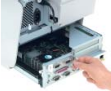
Carte mère sur rack permettant un accès facile aux barrettes mémoires et aux slots d'extension PCI