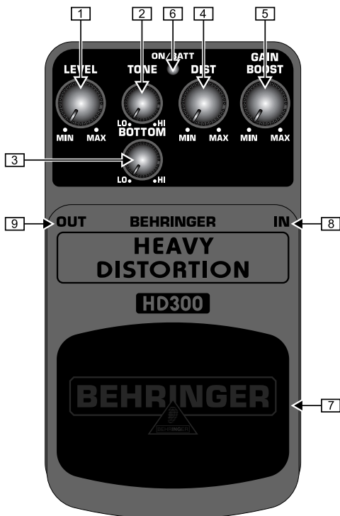
Vue d'en haut