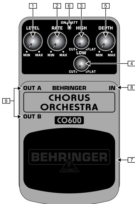
Vue d'en haut