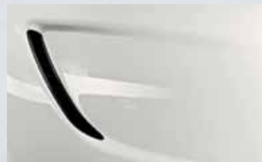
Olympic White 1

Les jantes spéciales OPC s'harmonisent à la perfection avec le design sportif. Elles réduisent le poids de suspension et améliorent la tenue de route et la maniabilité, conférant à l'Opel Insignia OPC une touche finale dynamique.