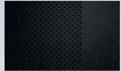
Finition: Piano Paint

Les sièges sport Recaro, avec sellerie mixte tissu/Morrocana, offrent un soutien et un confort exceptionnels. Un atout de taille, en particulier pour les longs trajets.