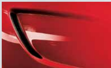
Power Red 1

Les teintes de carrosserie attrayantes contribuent à la magie de l'Opel Insignia OPC. Outre les nuances OPC uniques Arden Blue et Power Red, la palette comprend quatre autres couleurs hyper dynamiques. Chacune d'elles souligne le caractère éminemment sportif de l'Opel Insignia OPC.