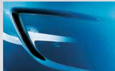
Arden Blue 3

Les teintes de carrosserie attrayantes contribuent à la magie de l'Opel Insignia OPC. Outre les nuances OPC uniques Arden Blue et Power Red, la palette comprend quatre autres couleurs hyper dynamiques. Chacune d'elles souligne le caractère éminemment sportif de l'Opel Insignia OPC.