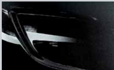
Carbon Flash 2