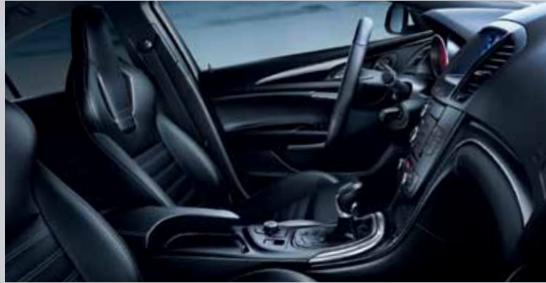
Cuir Siena, noir (perforé) 1

L'intérieur de l'Opel Insignia OPC s'adapte de multiples façons aux goûts et aux préférences du conducteur. Des tapis OPC exclusifs à l'ornement de plafond noir, en passant par le volant en cuir OPC et les pédales en aluminium – chaque élément répond aux exigences les plus strictes.