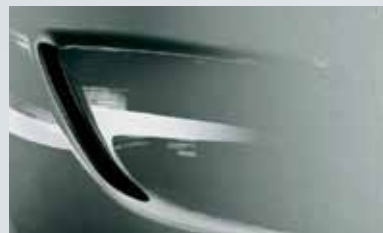
Silver Lake 2