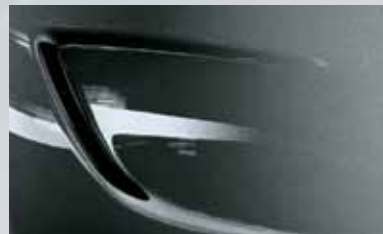
Technical Grey 2