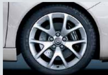
Jantes OPC en alliage 19" (Q9T). Aluminium moulé, finition brillante.

Les jantes spéciales OPC s'harmonisent à la perfection avec le design sportif. Elles réduisent le poids de suspension et améliorent la tenue de route et la maniabilité, conférant à l'Opel Insignia OPC une touche finale dynamique.