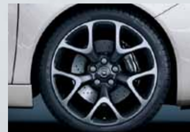
Jantes OPC en alliage 20" (R01). Aluminium forgé, peint en Technical Grey. Branches et bord extérieurs en finition polie brillante.