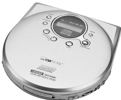
CDP 515 MP3

Compact-Disc portable Lettore portatile CD Portable CD Player Przenośny odtwarzacz CD Aparat de reda CD portabil