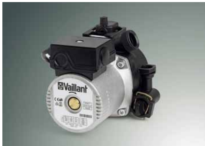
Pompe automatique à 2 vitesses