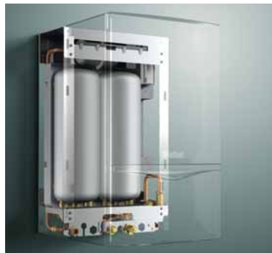
Ballon VIH CL 20 S

De plus, l'Aquakomfort System garantit une température d'ECS constante.