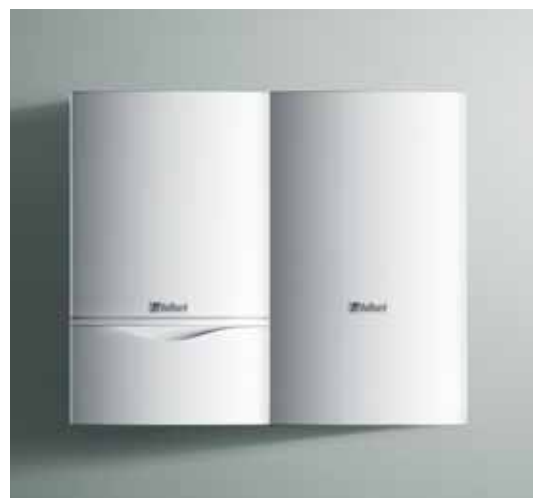
ecoTEC plus chauffage seul et VIH CB 75

Les ecoTEC plus systèmes sont l'association d'une chaudière ecoTEC plus chauffage seul avec un préparateur sanitaire. Les ecoTEC plus systèmes sont disponibles en 15, 24, 46 et 65 kW. Cette combinaison est la solution idéale pour des maisons avec plusieurs salles de bain ou équipées de douches exigeant des débits très élevés. Vaillant propose plusieurs types de ballons. Le ballon mural VIH CB 75 se place directement à côté de la chaudière. Pour de plus gros besoins en eau chaude sanitaire des ballons au sol cylindriques (120, 150, 200, 300, 400 ou 500 litres) sont aussi disponibles. Tous sont en acier émaillé et équipés d'une anode au magnésium ou à courant imposé (selon les modèles). La connection chaudière-préparateur s'effectue aisément grâce au kit de raccordement Vaillant. Pour les grandes puissances (46 et 65 kW) l'ajout d'une bouteille de mélange, adaptée au dimensionnement de l'installation globale, est obligatoire.