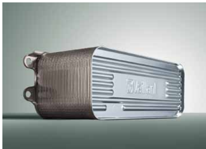
Echangeur secondaire 36 plaques