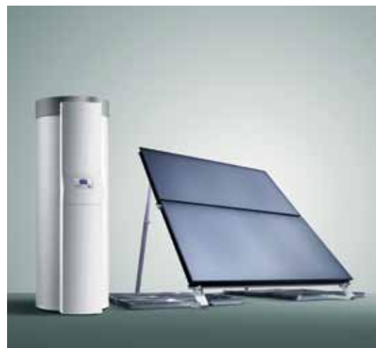
auroSTEP plus et capteurs VFK

Enfin, il bénéficie du crédit d'impôt de 50 % sur le matériel solaire et de 15 % sur la chaudière à condensation : condensation et solaire, une association gagnante !