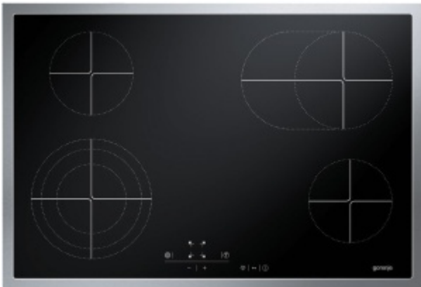
Table de cuisson vitrocéramique ECS780AX