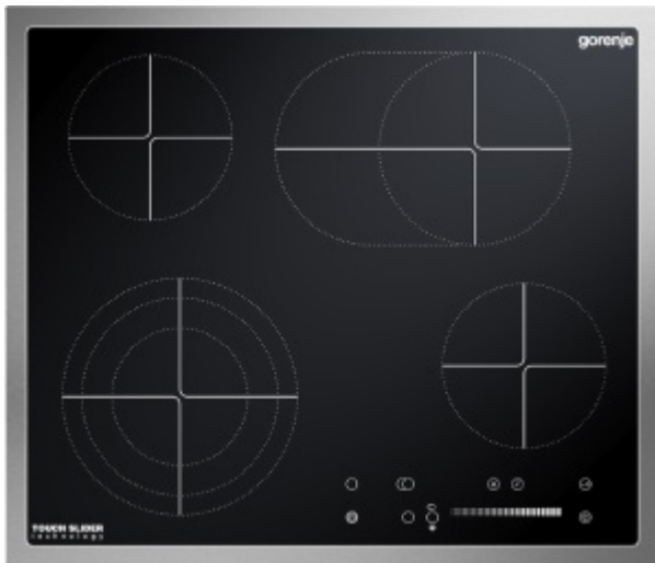
Table de cuisson vitrocéramique ECS680AX