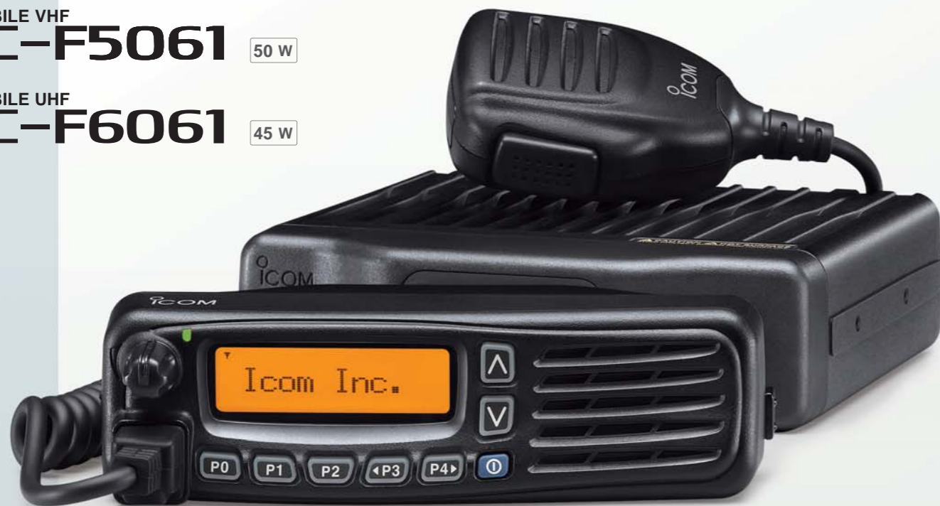
Mobile présenté avec kit de séparation face avant, RMK-3, et câble, OPC-609.