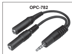
OPC-782 : Adaptateur pour casque et microphone

Les spécifications et informations données dans ce document peuvent être modifiées sans préavis. La configuration du poste peut varier suivant les versions.