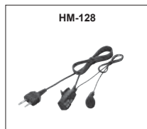
HM-128 : Oreillette avec microphone et PTT déportés prise 2,5-3,5mm