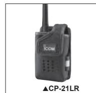
LC-161 Housse vinyle. Permet d'accrocher le portatif à la ceinture.