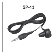
HM-128 : Oreillette