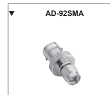
AD-92SMA Adaptateur antenne. Permet de connecter le portatif à une antenne externe BNC