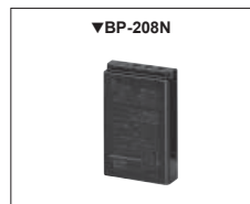
BP-243 : Batterie LI-ION 3,7 V 1800 mAh 20 h d'autonomie *Cycle Tx : Rx : Veille = 5 : 5 : 90