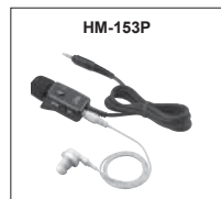
HM-153P : Microphone cravate prise 2,5-3,5 mm avec oreillette