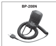
BP-208N : Microphone haut-parleur prise 2,5-3,5 mm