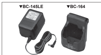
BC-164 Chargeur de bureau + BC-145LE AC Adaptateur secteur Charges la BP-243 en 3 h (approx.)