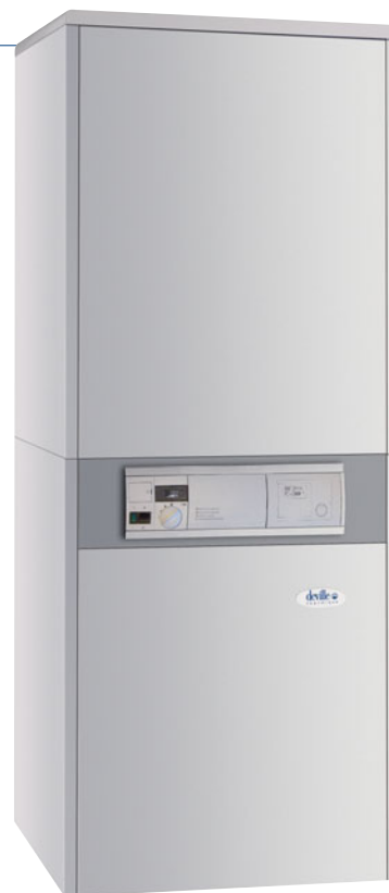
Modèle BTC / BTV