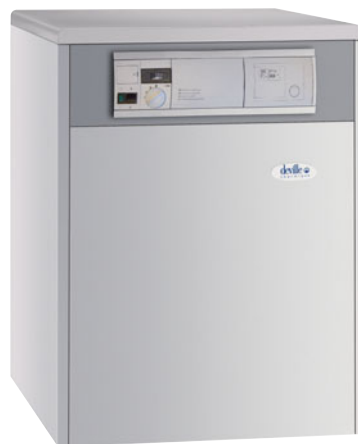
Modèle C / V