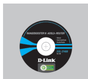
CD-ROM (L'utilitaire de configuration D-Link Click'n Connect, Le manuel utilisateur, Le guide d'installation)