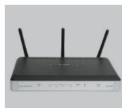
DSL-2740B Routeur RANGEBOOSTER N™ ADSL2+

Si l'un des éléments ci-dessus est manquant, veuillez contacter votre revendeur.