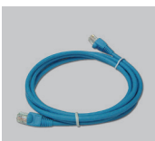
câble Ethernet catégorie 5